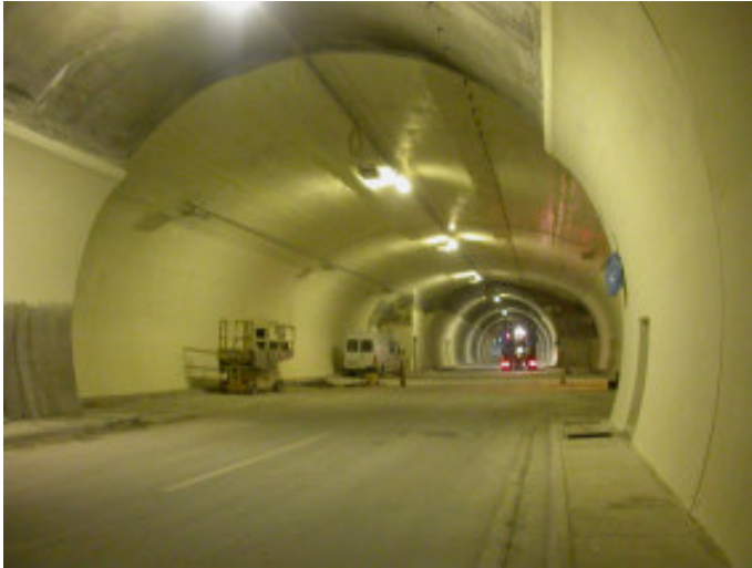
Ambergtunnel, A 14, Österreich, Spachtel-arbeiten mit VIBAPLAN AQUAPOX TU, und Beschichtungsarbeiten mit VIBACOAT AQUAPOX TU, (24'000 m 2 )